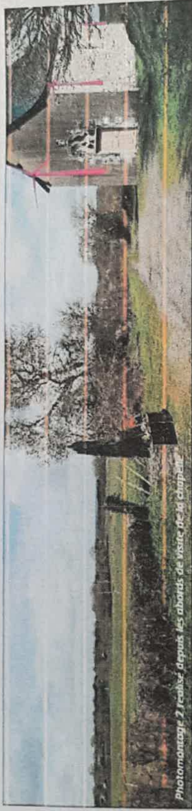
Photomontage 2. Feuille depuis les abords de visite de la chapelle

Photomontage la Croix Poulet Angrie 49 . Les éoliennes sont dessinées en rose sur la chapelle, d'après SAB Wind team elles disparaîtront derrière le bâti. Nous vous invitons à constater la réalité sur la photo page suivante. Le dernier trait rose sur le toit de la chapelle montre leur hauteur maximale